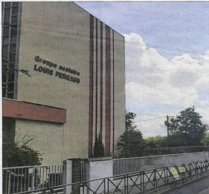
À proximité de l'école Louis-Pergaud, les terrains du Raquin sont un site de développement rare pour faire face à la croissance de la ville.